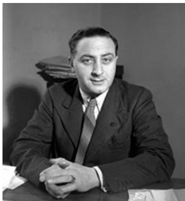
maart 1942, Sluysen was toen hoofd van de filmafdeling Regeeringsvoorlichtingsdienst te Londen

De tijd staat stil; en wij reizen er langs; van herinnering tot herinnering