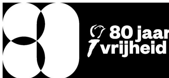
Afbeelding Nationaal Comité 4 en 5 mei