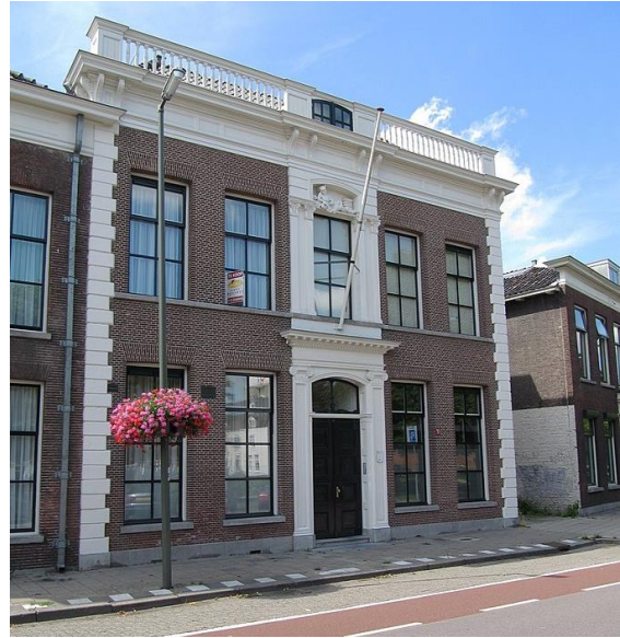
Het pand van het politiebureau

Bij belangstelling en als u informatie hebt kunt u zich wenden tot Chiel Wilbrink, mailadres: mm.wilbrink@hotmail.com of telefonisch via 06 - 40868231.