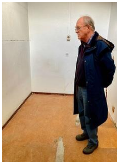
Onze voorzitter in cel 440 in het Oranjehotel, waar zijn vader zat.