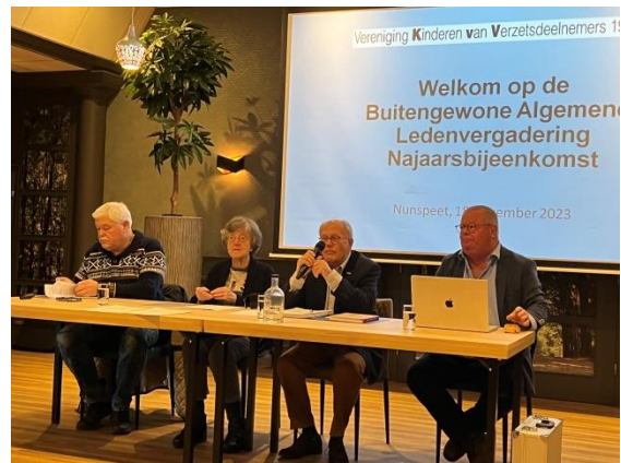
Het bestuur