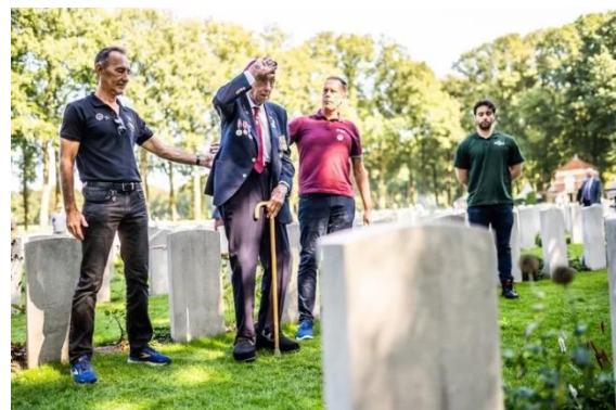
Begraafplaats Oosterbeek War Cemetery, foto Rolf Hensel / De Gelderlander

De voorbereidingen en de herdenkingen zelf liepen vlekkeloos in Gelderland, volkomen in contrast met de Dam. Deelnemer aan de herdenking in Oosterbeek Arthur Graaff van de Werkgroep 'Herdenk nazi's niet' zegt daarover: 'Probleem met de Dam is dat het monument daar gesticht is voor uitsluitend slachtoffers uit de oorlog, zoals de jaartallen in steen gebeiteld achterop het monument aangeven: 1940-1945. Maar daar zijn helaas in de loop der jaren allerlei groepen bij gesmokkeld, die niets met de vrijheidsstrijd tegen het nazisme / fascisme te maken hebben. Tegen die vermenging en dus verdunning is herhaaldelijk geprotesteerd, zonder gevolg. Het doel of de betekenis van een monument moet nooit opgerekt of vervormd worden en vooral onomstreden blijven.'