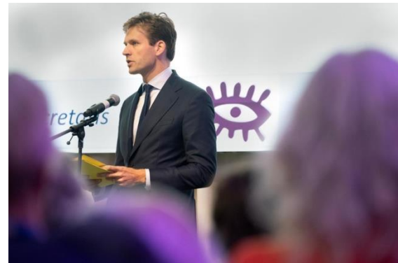
Vincent Karremans