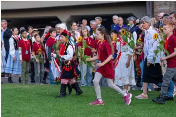
Nederlandse en Poolse kinderen legden bloemen bij het monument in de Berenkuil

Maar premier Schoof of andere regeringsleden lieten in Oosterbeek verstek gaan, ondanks dat dit de officiële herdenking is en ondanks de aanwezigheid van prinses Anne, toch de oudste zuster van een staatshoofd. Van Poolse zijde was er wel een zware officiële delegatie met minister van Veteranenzaken Parell, terwijl er ook ongeveer 200 Poolse scouts, voornamelijk uit Stettin, deelnamen.