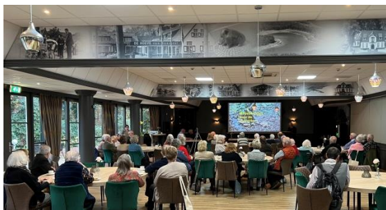
Boven: de zaal, onder: voorzitter leest de verklaring voor

Tussen de 40 en 50 leden en partnerleden bezochten De Najaarsbijeenkomst op 9 november. Het was in ieder geval droog buiten, maar files en mogelijk de ongeregelheden in Amsterdam zorgden ervoor dat veel leden erg laat arriveerden. Volgende keer (nog) vroeger vertrekken zou ik willen adviseren, want er is momenteel altijd iets aan de hand. Helaas. Maar de stemming was opperbest en veel leden maakten van het wachten gebruik om bij een kopje koffie of thee al flink met elkaar te communiceren.