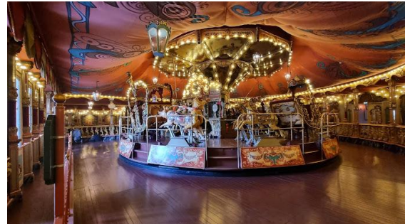
Stoomcarroussel Efteling

Redactie: Tiny heeft helaas geen enkele foto van een Kerstmis uit haar kindertijd, wel vonden wij op internet een foto van de stoomcarroussel in de Efteling.