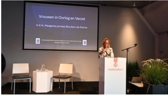
Prinses Margarita aan het woord

bleek te zijn. Hij lardeerde zijn vertellingen met veel beelden, o.a. van borduurwerken die zijn moeder tijdens haar gevangenschap gemaakt had, die als een soort dagboeken fungeerden. Ook liet hij filmpjes zien met interviews van kampgenoten van zijn moeder, die overigens in een buitenkamp van Dachau zat. Daarvoor had zij in Ravensbrück verbleven.